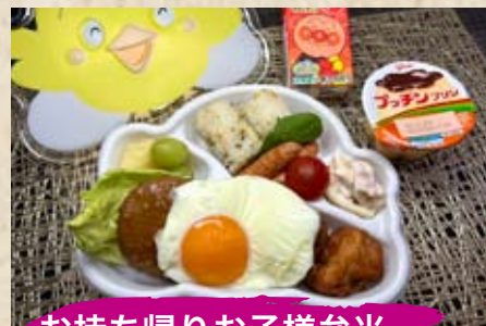
お持ち帰りお子様弁当